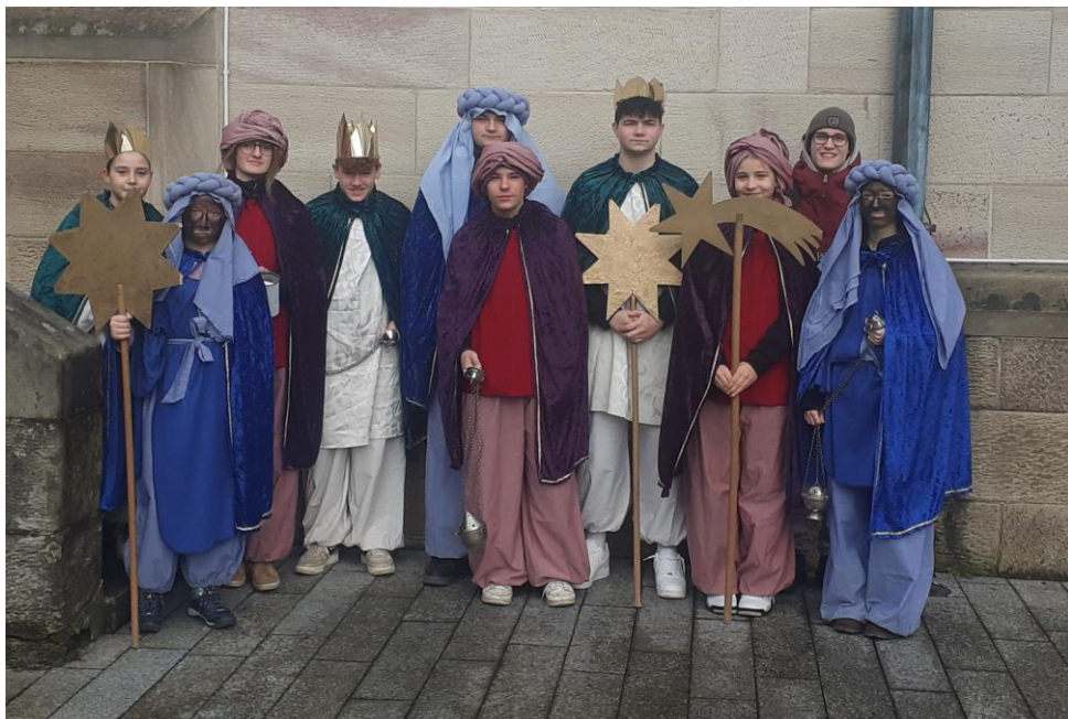
Sternsinger aus Obertsrot-Hilpertsau