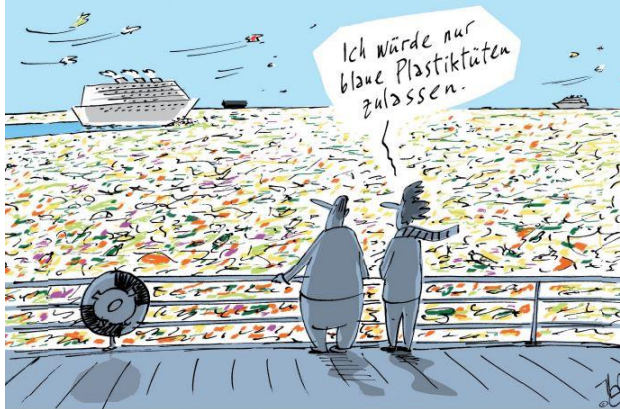
Titelbild der Karikaturenausstellung Glänzende Aussichten

Die Ausstellung bietet Bewusstseinsbildung mit Humor: In 99 Karikaturen zu Themen wie Lebensstil, Konsum, Klimawandel und Gerechtigkeit wagen 40 KünstlerInnen einen überraschend anderen Blick auf die Herausforderungen unserer Zeit. Auf witzige, verblüffende und manchmal auch erschreckende Weise regen sie zum Nachdenken an über die Abgründe unseres individuellen Verhaltens, aber auch über die großen weltpolitischen Zusammenhänge.