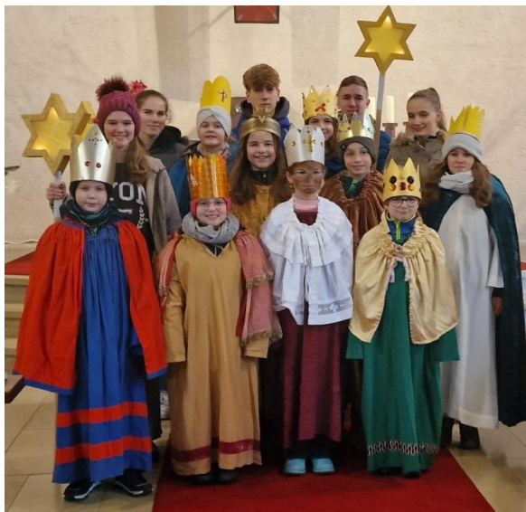
Sternsinger aus Lautenbach

Danke allen Sternsängern, Betreuern und Kleider-Beauftragte für ihren Einsatz!