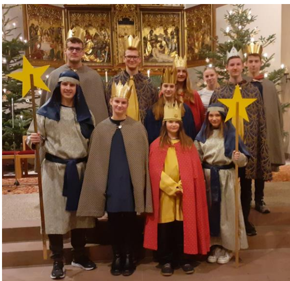
Sternsänger aus Reichental

Die Sternsänger haben zu Beginn des Jahres ein herzliches Willkommen bei den Besuchen in den Häusern erfahren. Sie waren an mehreren Tagen im gesamten Stadtgebiet unterwegs und brachten den Gruß 20 * C+M+B * 24 an. Dabei machten sie auf die Not von Kindern weltweit aufmerksam und baten um Spenden für Kinder in Not. In allen Ortsteilen waren Gruppen unterwegs. In Reichental, Lautenbach und Obertsrot waren jeweils drei Gruppen in der ersten Januarwoche unterwegs und haben viel Freude in die Familien gebracht. Unter den Sternsängern waren einige Ministranten, aber auch zukünftige Kommunionkinder dabei. Viele der über 50 Kinder